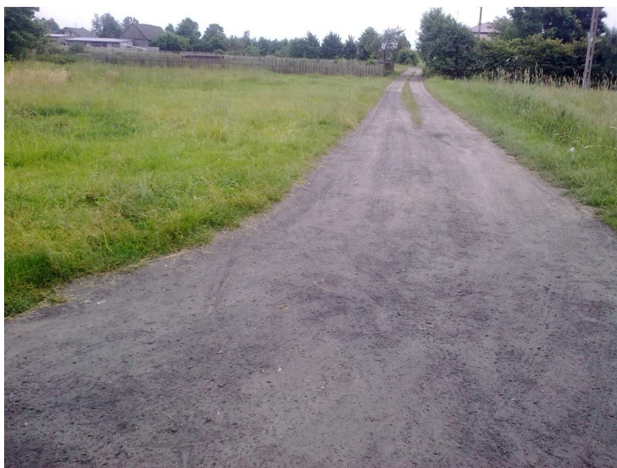
Fot.16. Droga prowadząca do posesji.