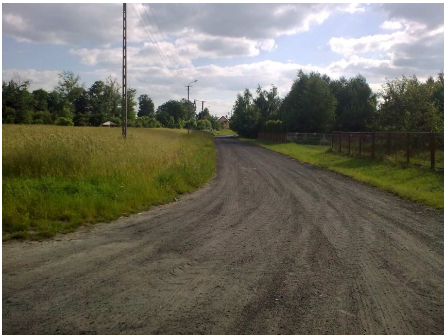
Foto.14. Droga prowadząca do Małyszyna.

Boisko (na którym odbywają się rozgrywki reprezentantów naszej wsi) wymaga gruntowego remontu. Nieodzowne staje się również odnowienie bieżni położonej obok boiska.