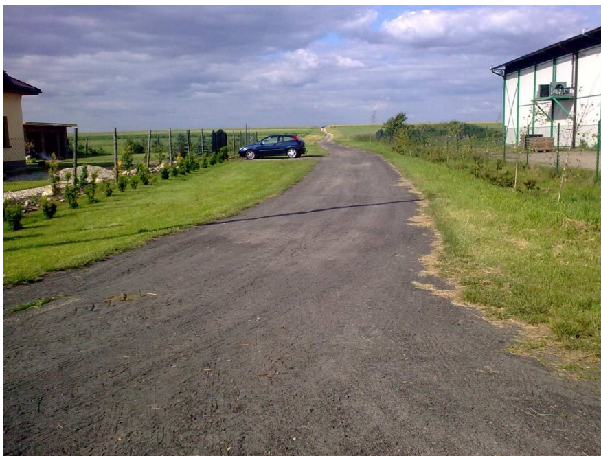
Foto.9. Droga prowadząca do terenów leśnych