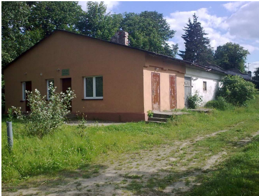
Foto.11. Szatnia Klubu wraz z budynkiem domu młodzieżowego.

Dom młodzieżowy wymaga dużych nakładów inwestycyjnych w postaci odnowy zewnętrznej części wyżej wymienionego budynku.