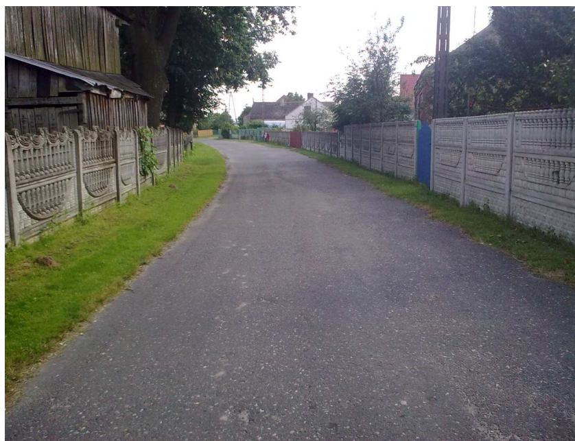
Foto.6. Widok drogi gminnej dojazd do większości posesji we wsi.

Uwagę należy skupić również na budynku Klubu LKS „Park” Starzenice, który znajduje się przy boisku sportowym i placu zabaw, gdzie odbywają się różnego rodzaju uroczystości gminne i wioskowe, typu coroczne festyny pod nazwą „Dzień Dziecka”, które na stałe już weszły do kalendarza imprez wioskowych.