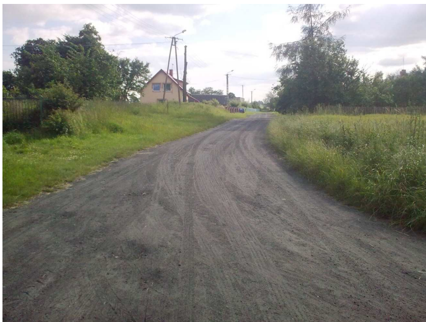
Foto.10. Droga łącząca Starzenice z miejscowością Małyszyn.

Powyższe drogi wymagają położenia nawierzchni asfaltowej oraz budowy wzdłuż wyżej wymienionych dróg chodnika dla pieszych.