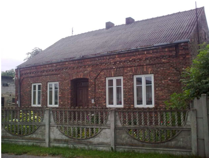
Foto.3. Budynek z okresu przedwojennego