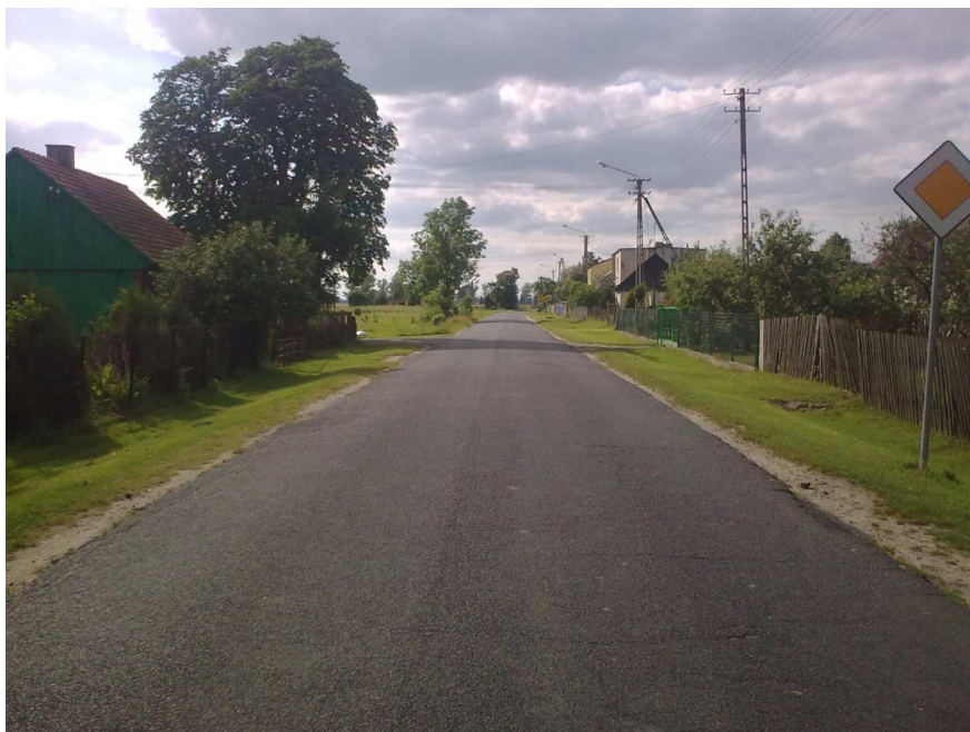
Foto.5. Droga powiatowa, brak chodników.