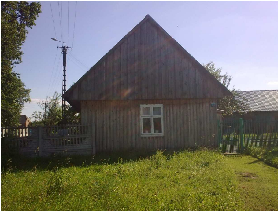
Foto.2. Budynek z okresu przedwojennego.