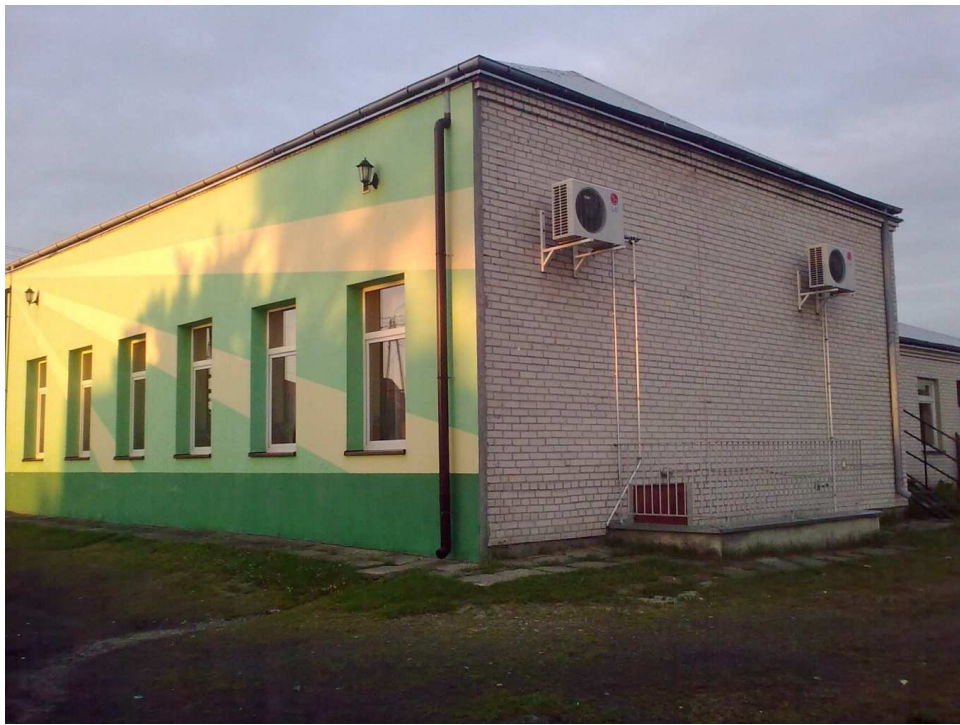
Foto.17. Budynek Domu Ludowego – sala bankietowa „Wenecja” w Starzenicach.