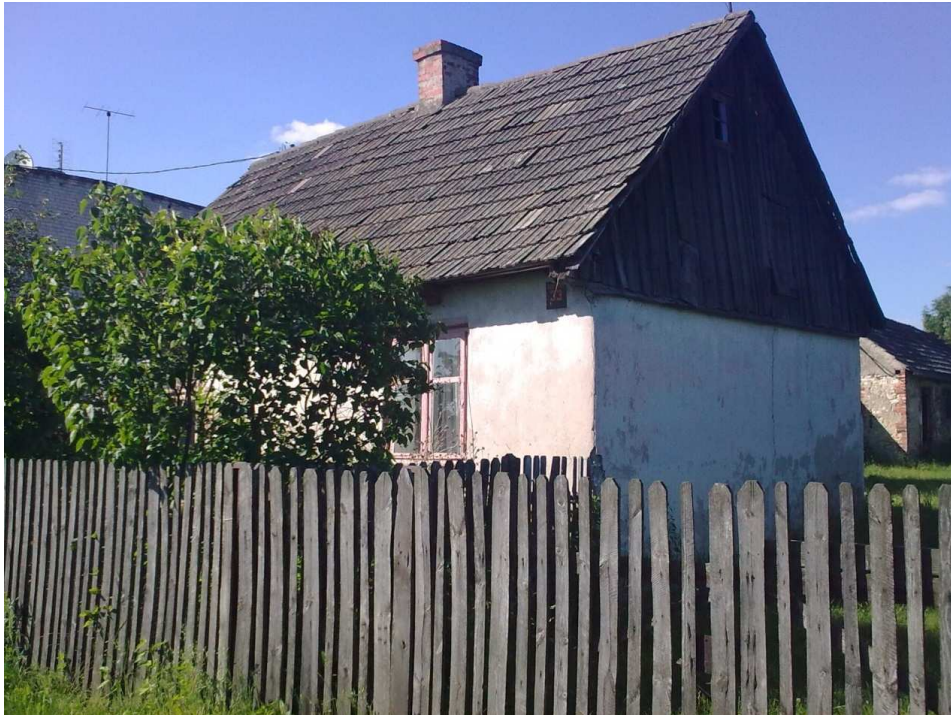
Foto.1. Budynek z okresu przedwojennego.