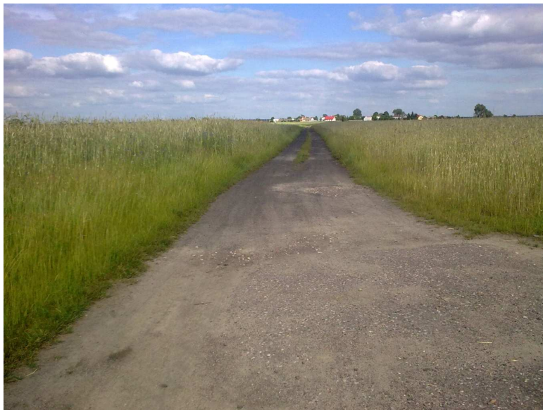
Foto.7. Droga gminna łącząca Starzenice z miejscowością Sieniec.

W naszej miejscowości znajdują się obiekty oraz drogi, które wymagają szybkich działań w postaci remontów i budowy od podstaw.