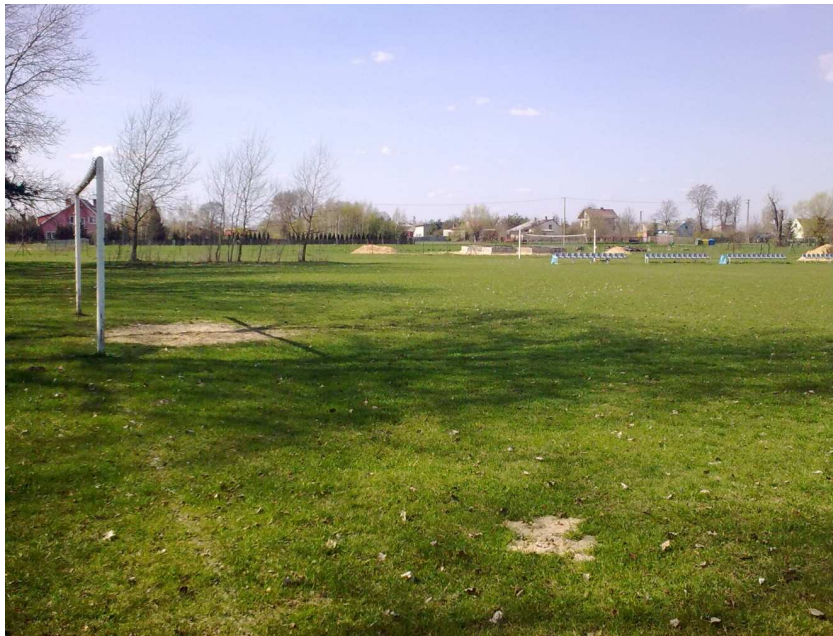
Foto.13. Boisko sportowe miejscowego Klubu.

Boisko (na którym odbywają się rozgrywki reprezentantów naszej wsi) wymaga gruntowego remontu. Nieodzowne staje się również odnowienie bieżni położonej obok boiska.