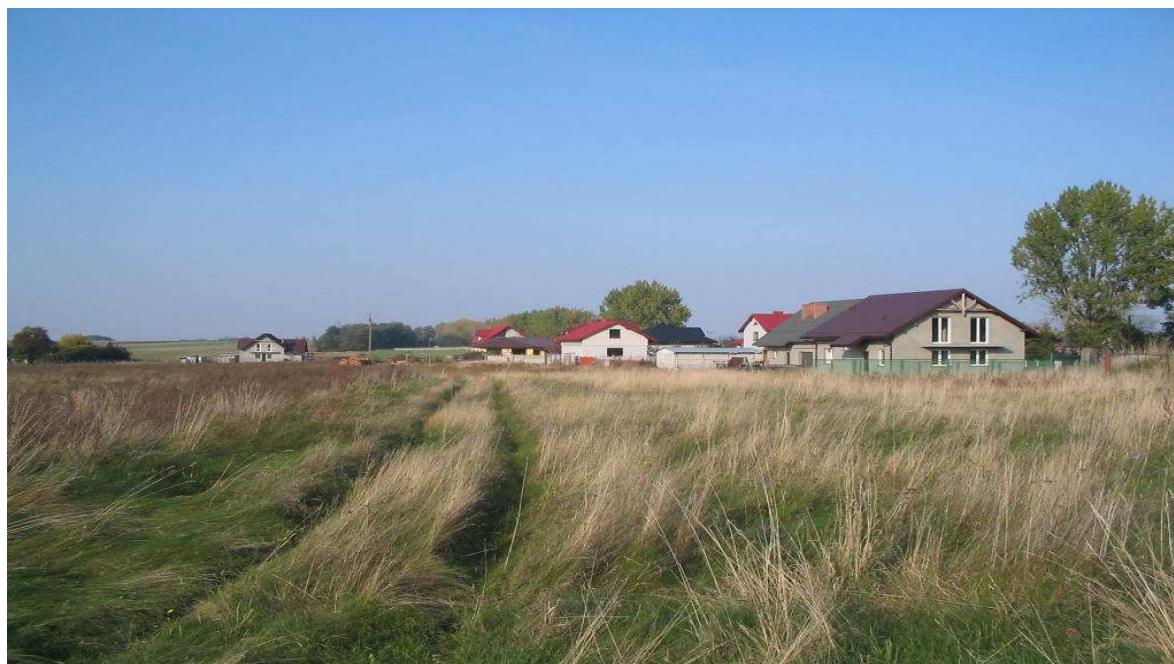
Dojazd do posesji na nowym osiedlu