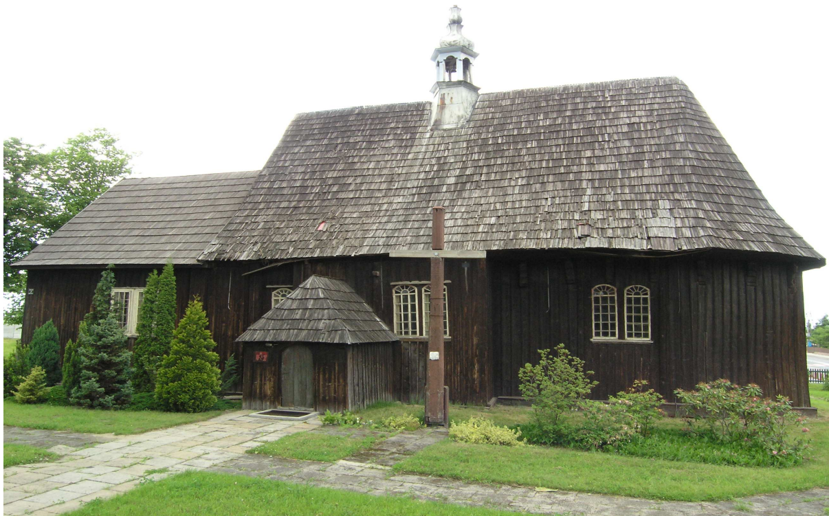
Zabytkowy kościół z XVI w. w Kadłubie