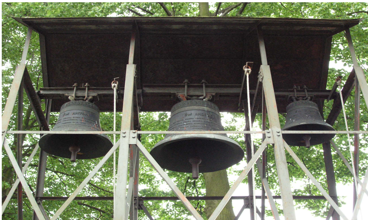
Dzwonnica z zabytkowym dzwonem z XV w. w Kadłubie