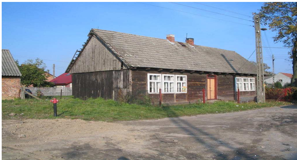
Szkoła z lat powojennych

W naszej miejscowości znajduje się również budynek z lat powojennych, w którym mieściła się szkoła. Obecnie w planach powstał pomysł aby zaadaptować budynek na skansen.