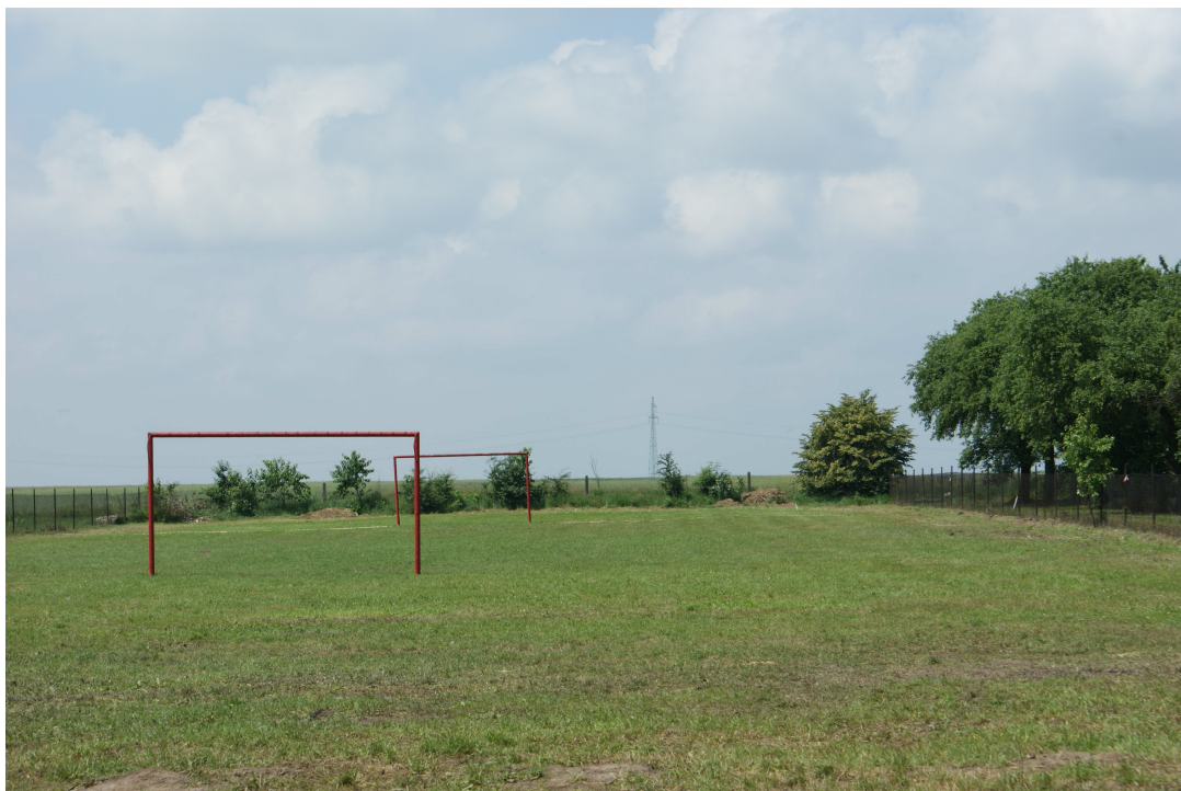
Plac boiska sportowego

Plac boiska jest nieutwardzony i nie posiada ławek dla kibiców. Obok boiska sportowego należy wybudować od podstaw plac zabaw dla dzieci.