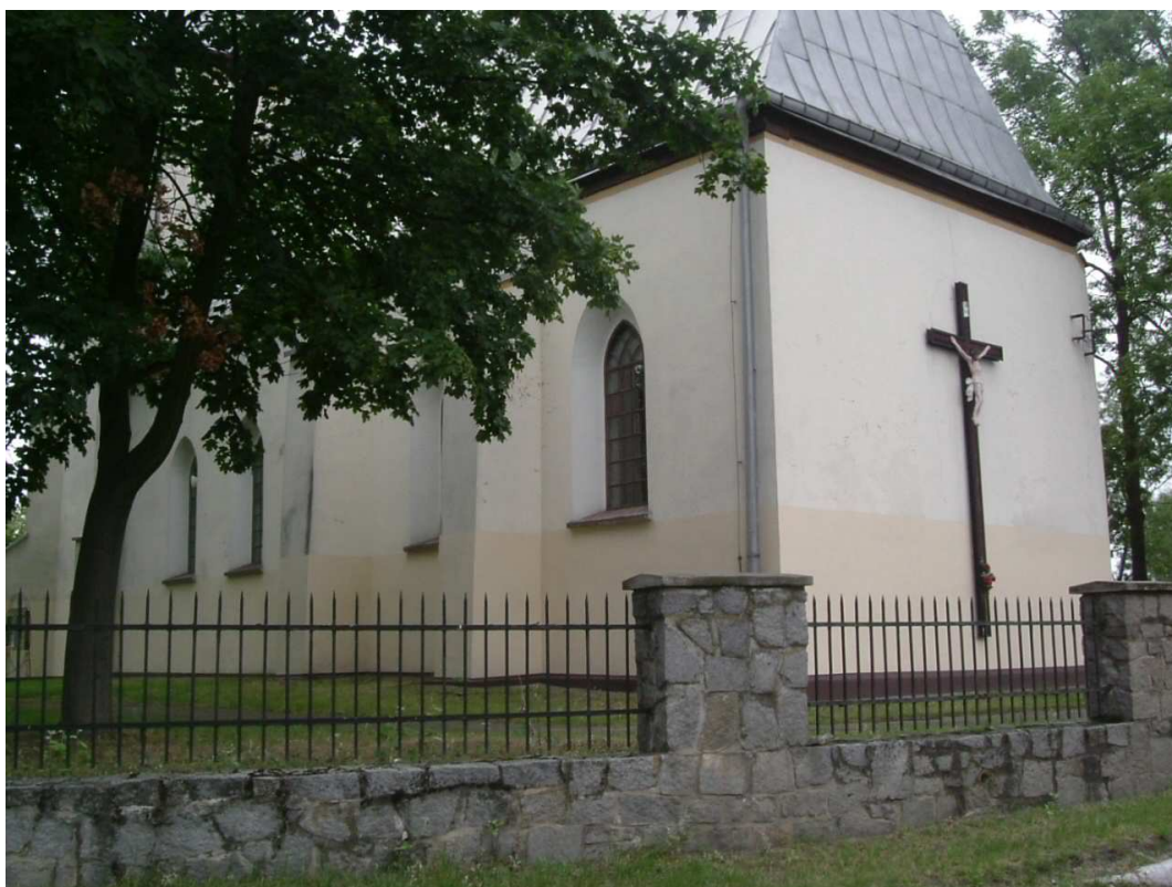
Fot. nr 2 Kościół parafialny w Dąbrowie p.w. św. Wawrzyńca – widok od strony południowo- wschodniej.