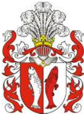
Herb rodu Wadwiczów

Dąbrowa jest starą wsią o średniowiecznym rodowodzie osadniczym, położoną na granicy Wyżyny Wieluńskiej i nizinnego obszaru Wysoczyzny Wieruszowskiej, w odległości około 1 km na południe od płynącej z zachodu na wschód rzeki Pysznej. Rozległy system wodny tej ostatniej rzeki, z licznymi ciekami wodnymi i obszarami mokradeł (obecnie w znacznej mierze osuszonych), stanowi nizinne obramowanie północno-wschodniego skraju Wyżyny Wieluńskiej.