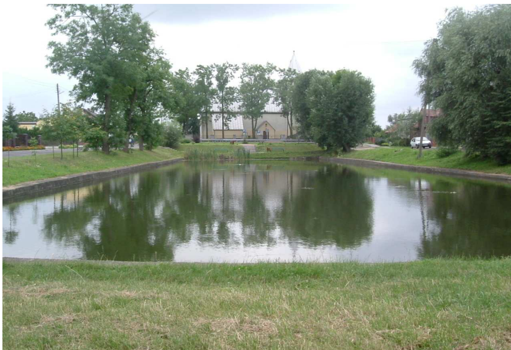
Fot. nr 1 Kościół parafialny w Dąbrowie p.w. św. Wawrzyńca –widok od strony północnej.