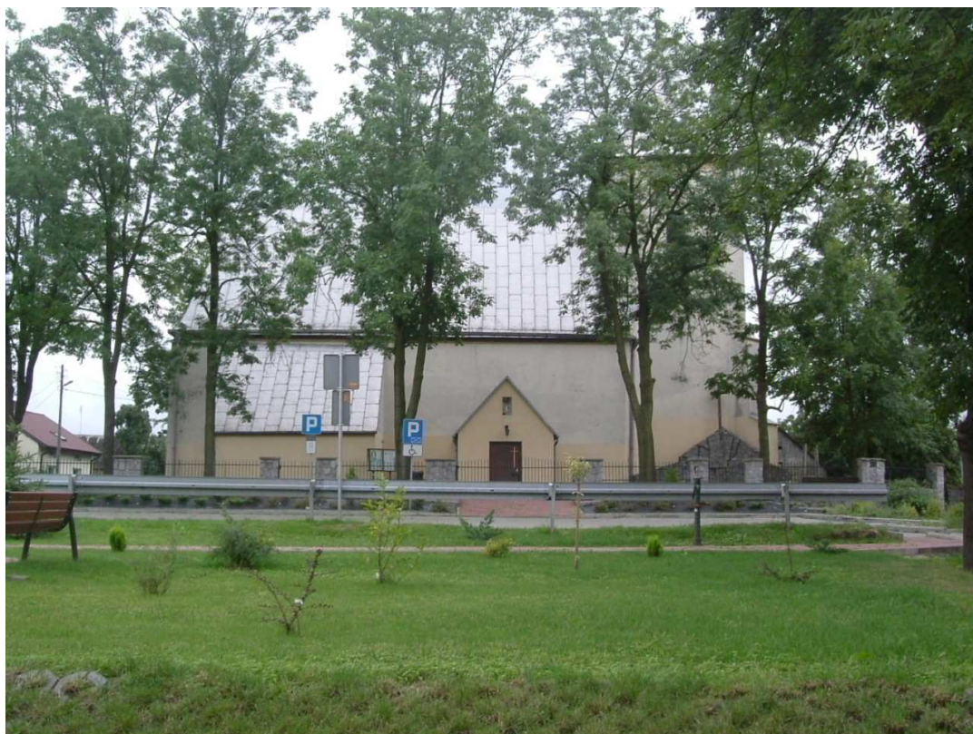
Fot. nr 3 Kościół parafialny p.w. św. Wawrzyńca w Dąbrowie - strona północna.