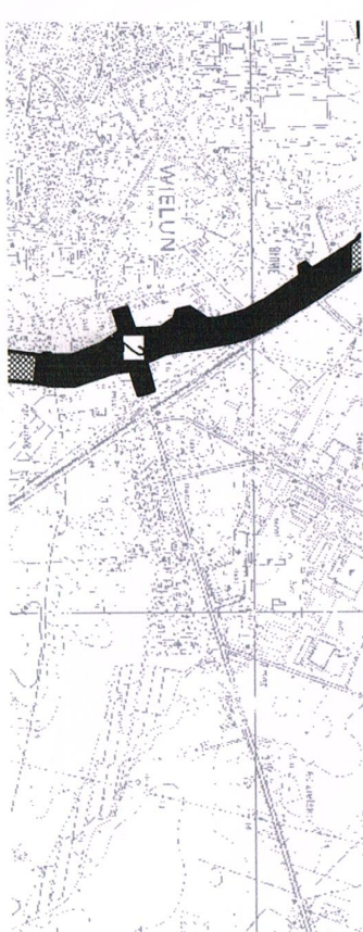
Skic lokalizacji SKALA 1:25000

Wydawnictwo RODMARK ul. Rynek 10 50-100 Wrocław tel. 71 374 14 14 www.rodmark.pl