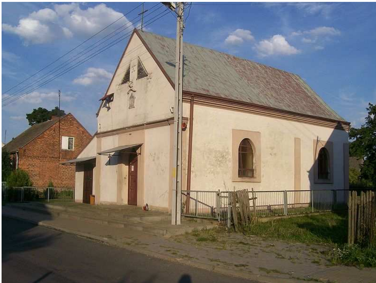
Foto. 2. Kaplica z przełomu XIX i XX wieku. Obecnie pełni rolę kaplicy cmentarnej.

kaplicy cmentarnej, służącej do przechowywania zwłok. Oprócz wyżej wymienionej kaplicy, w Sieńcu jest również nowy murowany kościół, który został zbudowany w 2006 roku, dzięki zaangażowaniu finansowemu mieszkańców nowo utworzonej w 2000 roku parafii. Wybudowano również ze składek parafian nowy cmentarz.