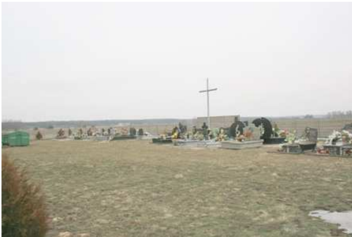
Foto. 3. Nowy cmentarz administrowany przez parafię w Sieńcu.

W naszej miejscowości znajdują się obiekty oraz drogi które wymagają szybkich działań w postaci remontów i budowy od podstaw.