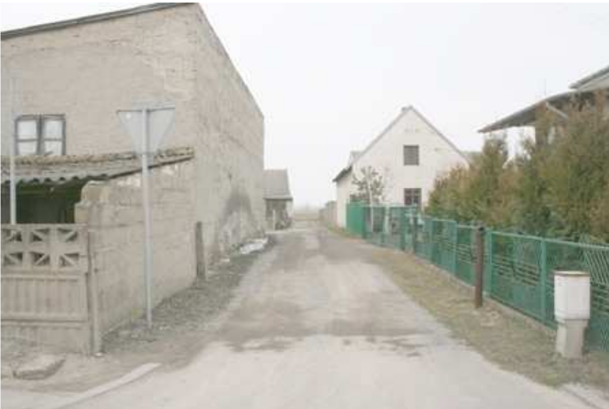
Foto. 16. Droga gminna dojazdowa do posesji

Powyższa droga nie posiada utwardzenia. Drogą tą są dowożone między innymi dzieci z Jodłowca do szkoły w Sieńcu. Droga wymaga położenia nawierzchni asfaltowej oraz chodnika.