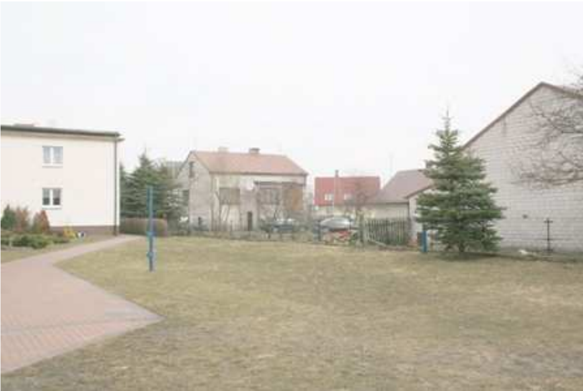
Foto.12. Boisko szkolne do piłki siatkowej.

Boiska szkolne do piłki ręcznej i piłki siatkowej wymagają gruntownego remontu ponadto wskazana jest również odnowa elewacji budynku szkolnego, remont korytarza dolnego i szatni, wymiana mebli w salach lekcyjnych, rozbudowa i wyposażenie placu zabaw. Wskazane są również inwestycje w postaci rozbudowy sali gimnastycznej oraz komputerowej.