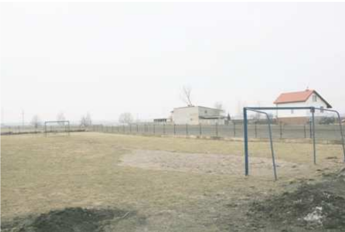
Foto. 11. Boisko szkolne do piłki ręcznej.

Teren przeznaczony pod boisko sportowe wymaga gruntownej adaptacji. Do 2008 roku było to pole orne. W chwili obecnej jest tam jedynie zasiana trawa. Cały teren wymaga przystosowania do spełniania funkcji boiska sportowego.