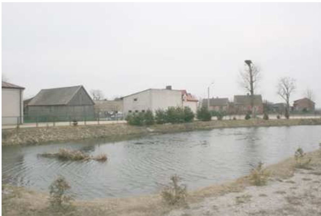
Foto. 14. Staw przy remizie OSP w Sieńcu.

Nieodzowne staje się również utwardzenie kostką brukową, placu przed i wokół kościoła. Obecnie teren ten jest wywieziony jedynie żużlem. Na placu tym odbywają się częste uroczystości kościelne i świeckie. Ponadto, kościół znajduje się w kompleksie budowy placu zabaw i budowy gminnych dróg asfaltowych. Realizacja tego zadania inwestycyjnego wpłynie pozytywnie na kompleksową estetykę tego rejonu wioski.