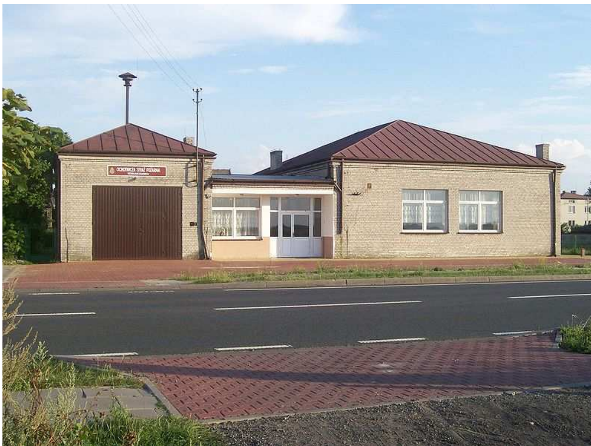
Foto. 8. Remiza i strażnica OSP w Sieńcu.

Teren ten wymaga zagospodarowania w postaci wyrównania nawierzchni, ogrodzenia, zakupu wyposażenia placu zabaw i montażu urządzeń.