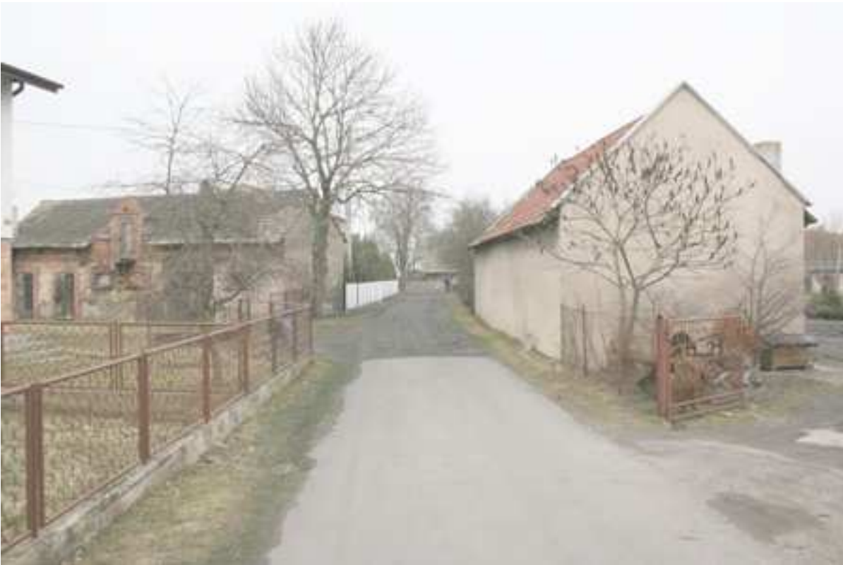
Foto. 17. Droga gminna do posesji od drogi krajowej nr 8.