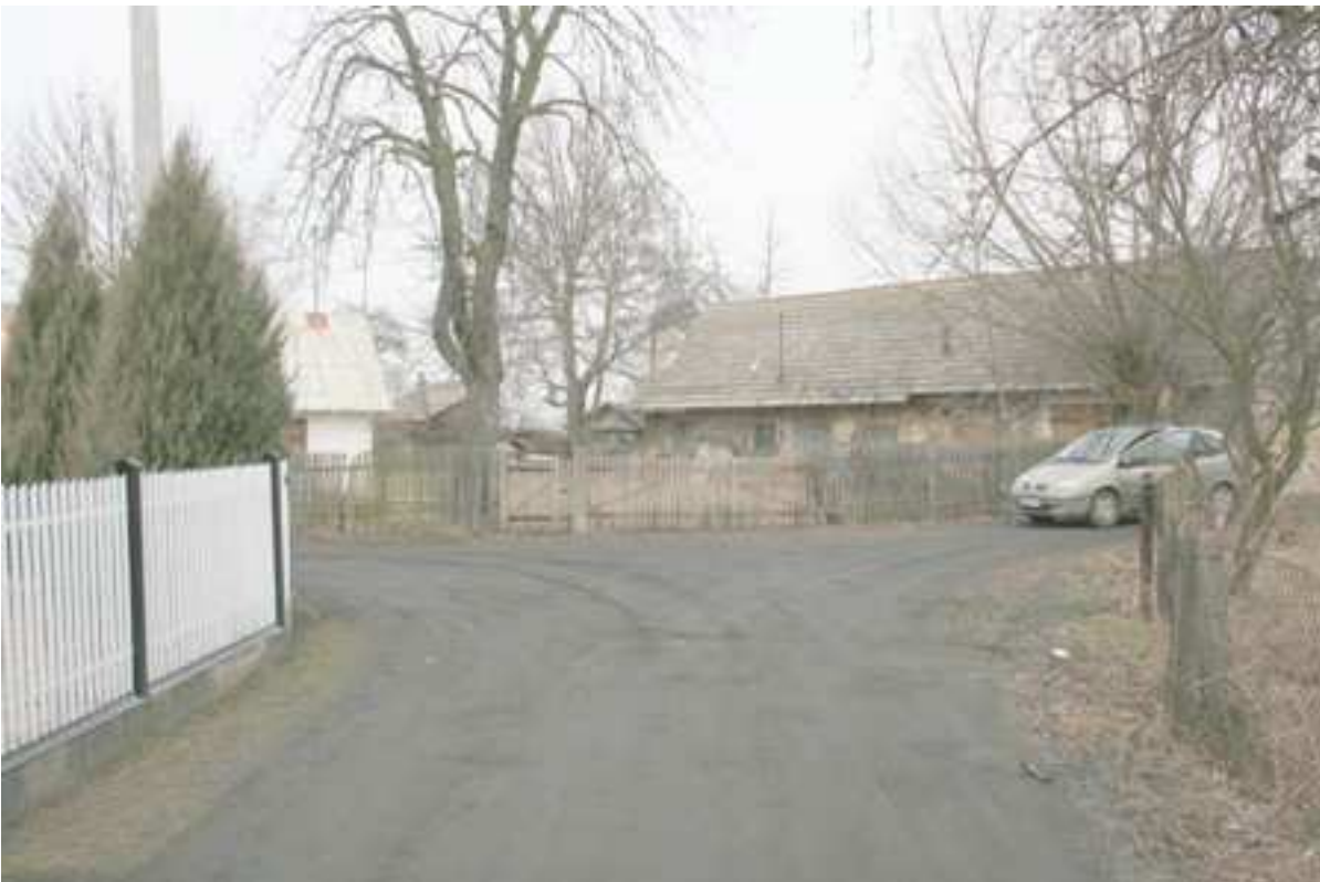
Foto. 18. Droga gminna dojazdowa do posesji od drogi krajowej nr 8 do tzw. „drogi Leśnej”, potocznie zwana „Skotnicą”.