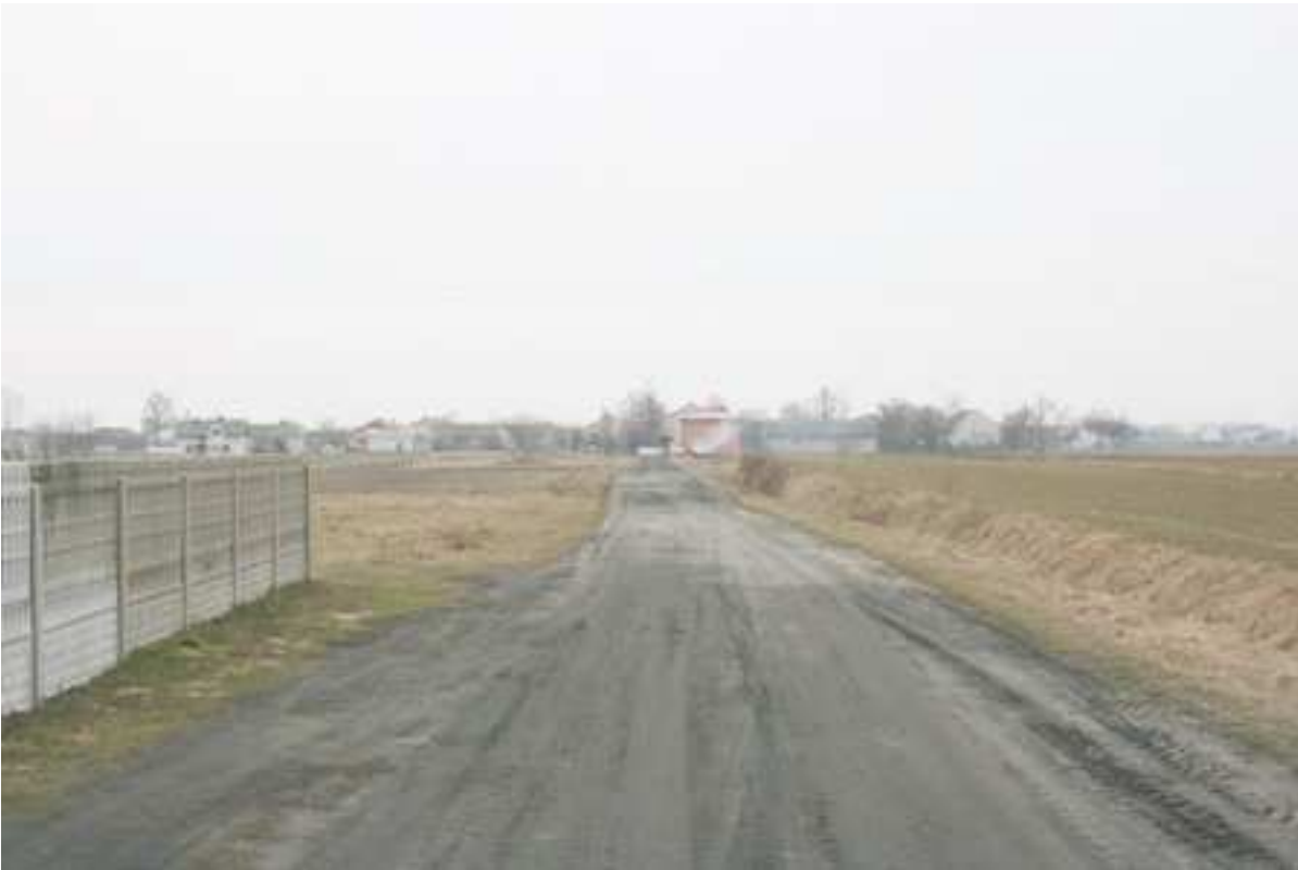
Foto. 4. Droga gminna tzw. „Leśna”, prowadząca od drogi krajowej nr 8 do cmentarza.(widok od strony cmentarza).