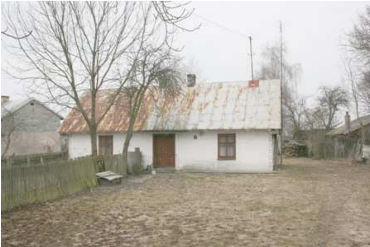
Foto. 1. Budynek drewniany z przełomu XIX i XX wieku.

We wsi Sieniec nie występują żadnego rodzaju zabytki. Jedynie w ewidencji konserwatorskiej gminy, znajduje się jeden budynek drewniany z przełomu XIX i XX wieku oraz budynek drewniany z 1935 roku i dwa murowane z 1935 i 1946 roku oraz murowana kaplica z przełomu XIX i XX wieku.