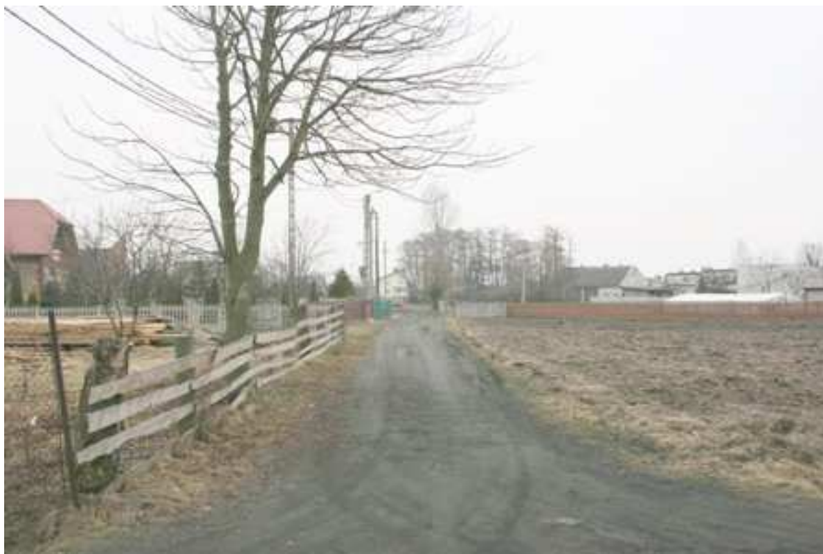
Foto. 6. Droga gminna od tzw. „drogi Leśnej” do drogi krajowej nr 8 (biegnąca obok kościoła).

Powyższe drogi wymagają położenia nawierzchni asfaltowej oraz budowy wzdłuż wyżej wymienionych dróg, chodnika dla pieszych.