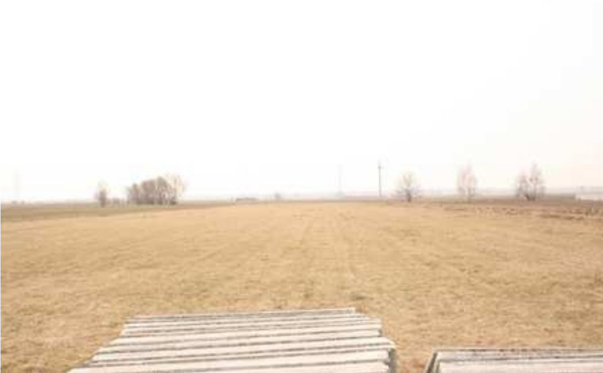
Foto. 10. Działka gminna przeznaczona pod boisko sportowe.

Teren przeznaczony pod boisko sportowe wymaga gruntownej adaptacji. Do 2008 roku było to pole orne. W chwili obecnej jest tam jedynie zasiana trawa. Cały teren wymaga przystosowania do spełniania funkcji boiska sportowego.