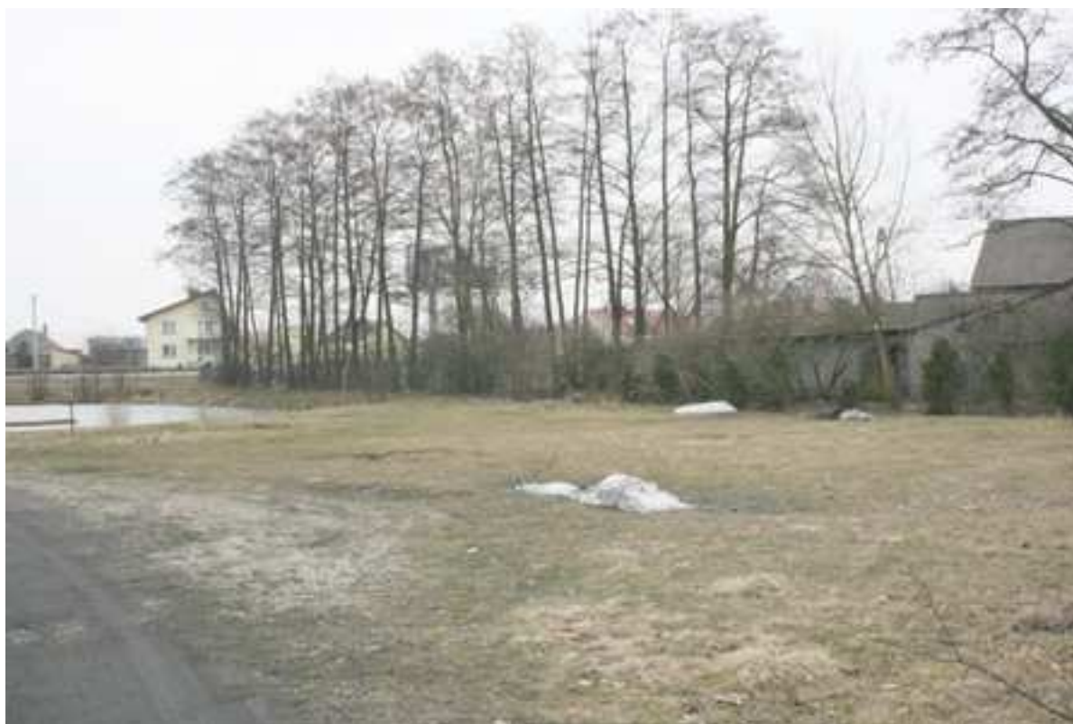
Foto. 7. Plac na działce gminnej przy stawie obok kościoła, przeznaczony pod plac zabaw dla dzieci.

Powyższe drogi wymagają położenia nawierzchni asfaltowej oraz budowy wzdłuż wyżej wymienionych dróg, chodnika dla pieszych.