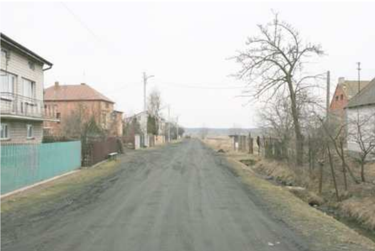
Foto. 5. Droga gminna tzw. „Leśna”, prowadząca od drogi krajowej nr 8 do cmentarza. (widok od strony drogi krajowej nr 8).