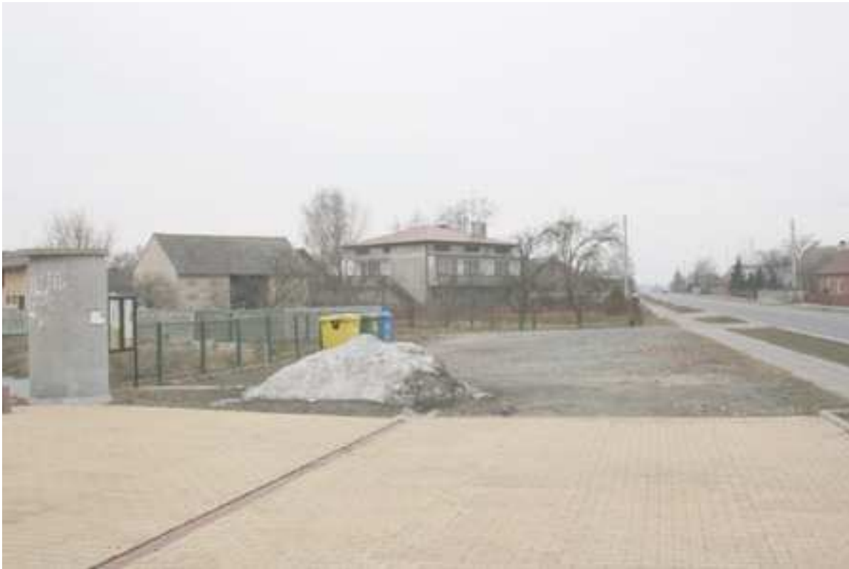
Foto. 9. Plac przy remizie OSP, między stawem a drogą krajową nr 8.

Uwagę należy skupić również na budynku Ochotniczej Straży Pożarnej, który znajduje się w centrum wsi, gdzie odbywają się różnego rodzaju uroczystości gminne i wioskowe, typu dożynki, coroczne festyny pod nazwą „Powitanie lata”, które na stałe już weszły do kalendarza imprez gminnych. Remiza wymaga wyposażenia głównie w nowe stoły i krzesła oraz instalacje grzewczą wraz z kotłownią. Jednak priorytetową sprawą jest wykonanie ocieplenia i elewacji ścian zewnętrznych budynku. Aby cały teren wraz z przylegającym stawem wyglądał estetycznie i spełniał funkcje centrum rekreacji należy także utwardzić kostką brukową teren parkingowy położony między stawem a drogą krajową nr 8.