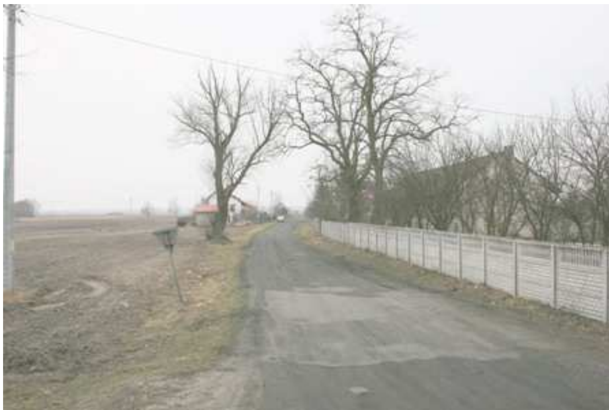
Foto. 19. Droga gminna dojazdowa do posesji od drogi krajowej nr 8 do boiska sportowego.