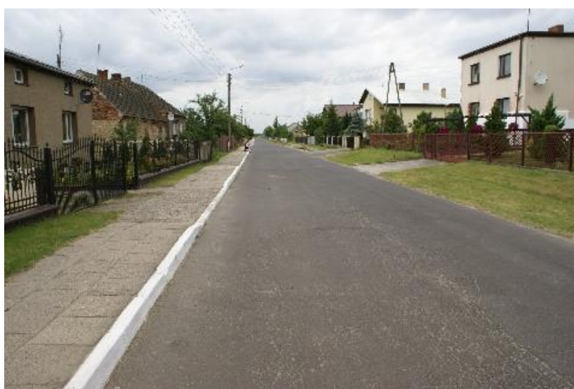
Foto nr 9 – Droga „bugaj” wymagająca wymiany kostki brukowej na chodniku oraz budowy kanalizacji burzowej zakrytej