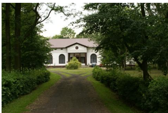
(foto nr 1- Zabytkowy dwór w Masłowicach z 1820 r. wraz z kompleksem parkowym)