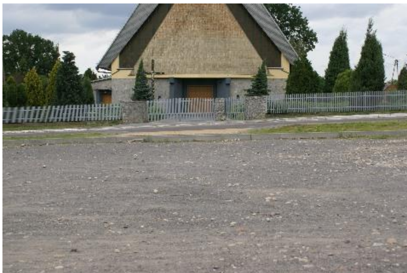
Foto nr 10– Parking przy kościele wymagający położenia kostki brukowej