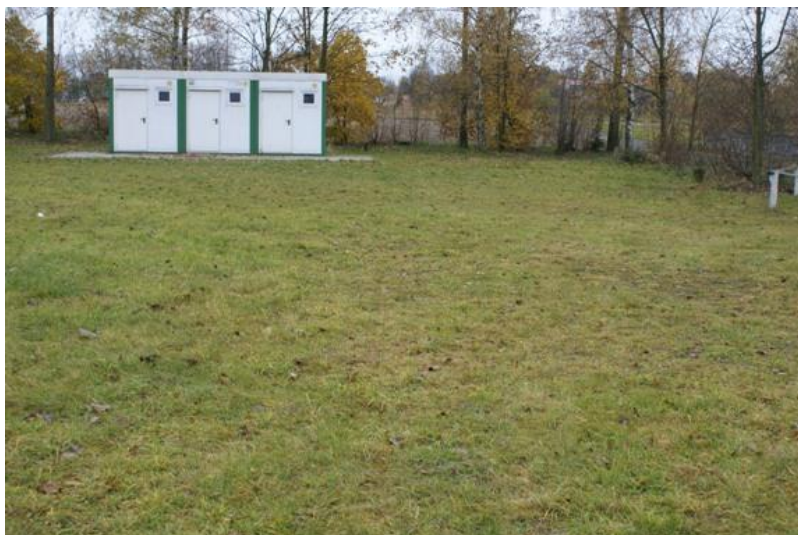
Foto nr 19 – boisko w części do zagospodarowania na kort tenisowy