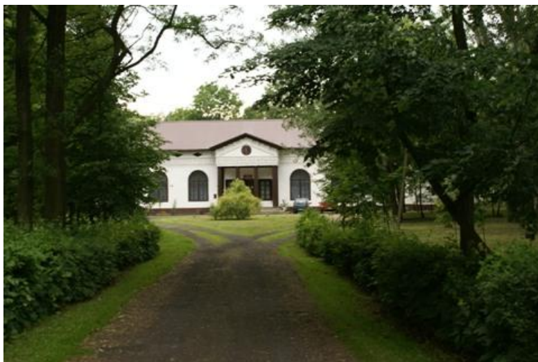
Foto nr 1- Zabytkowy dwór w Masłowicach z 1820 r. wraz z kompleksem parkowym