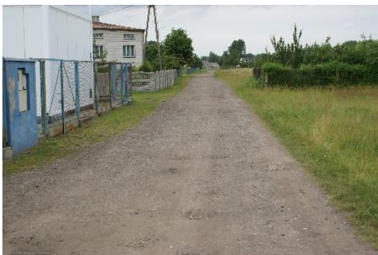
Foto nr 6 – Droga gminna tzw. „ogrody”, prowadząca od drogi nr 481, wymagająca położenia asfaltu