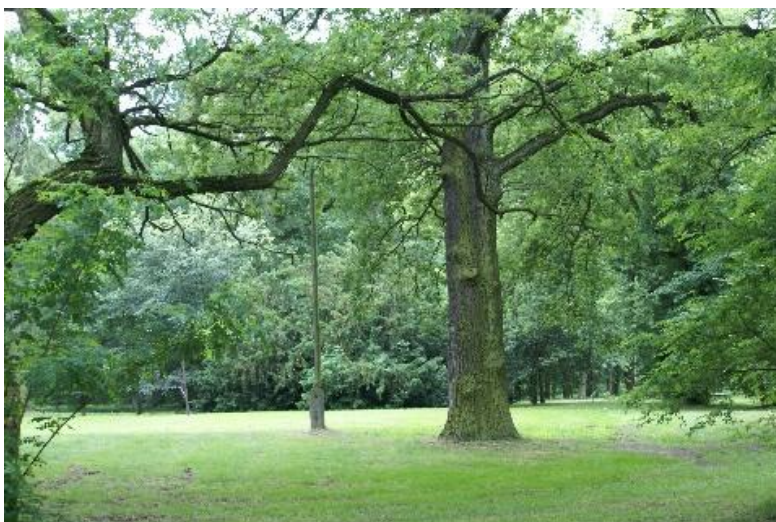
Foto nr 2- zabytkowy podworski kompleks parkowy w Masłowicach