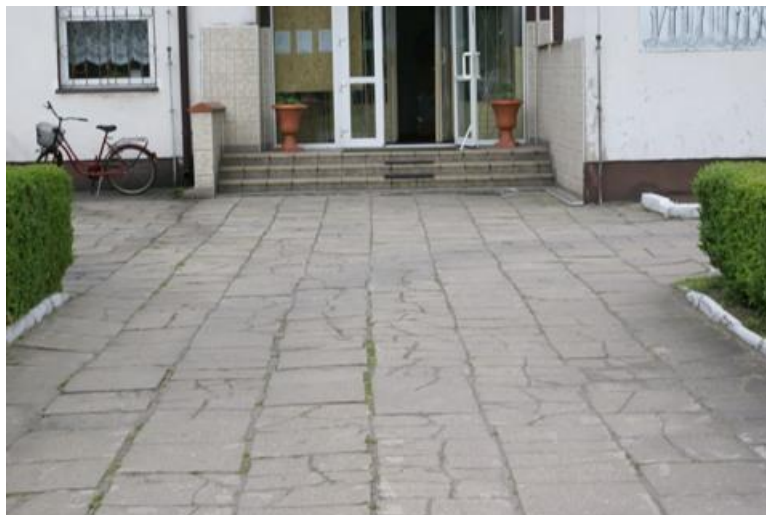
Foto nr 4 – Chodnik przed wejściem do Szkoły Podstawowej w Masłowicach