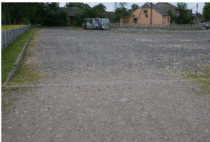
Foto nr 11 – Parking przy kościele wymagający położenia kostki brukowej, ujęcie dalsze