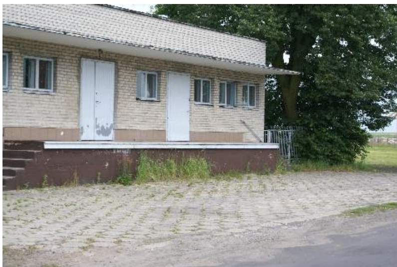
Foto nr 20 – budynek po byłej zlewni mleka do zagospodarowania na świetlicę